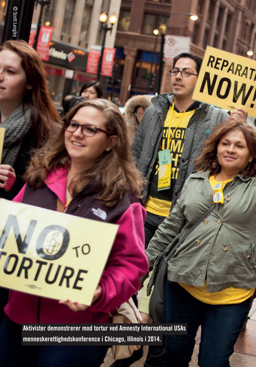
Aktivister demonstrerer mod tortur ved Amnesty International USAs menneskerettighedskonference i Chicago, Illinois i 2014.