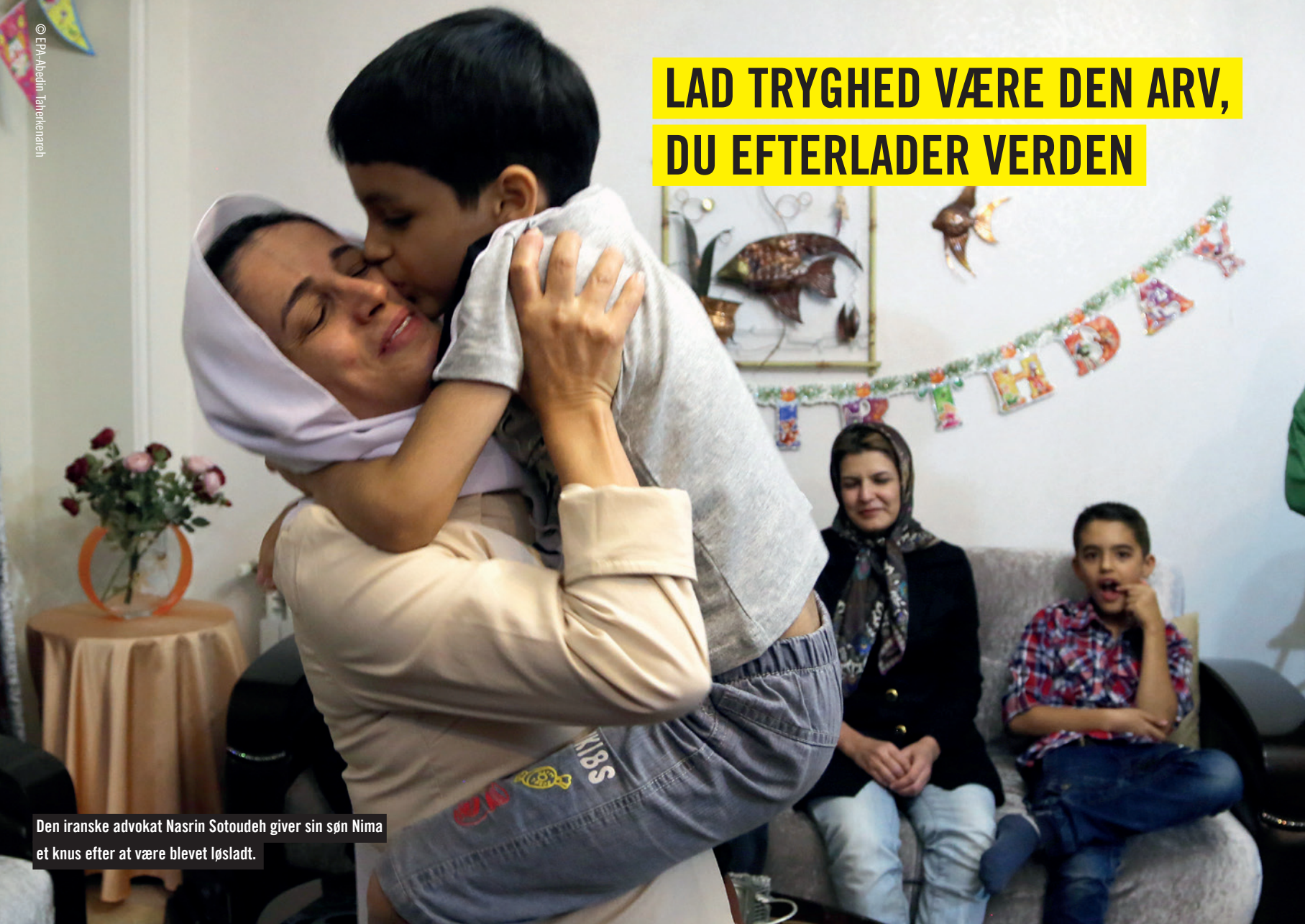
Den iranske advokat Nasrin Sotoudeh giver sin søn Nima et knus efter at være blevet løsladt.