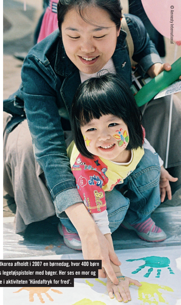
Amnesty i Sydkorea afholdt i 2007 en børnedag, hvor 400 børn byttede deres legetøjspistoler med bøger. Her ses en mor og datter deltage i aktiviteten 'Håndaftryk for fred'.

Vi står altid til rådighed. Vi vil besvare din henvendelse så hurtigt som muligt. Kontakt vores arveansvarlige Mette Vinggaard Hellerung på 33 45 65 58 eller mvhellerung@amnesty.dk