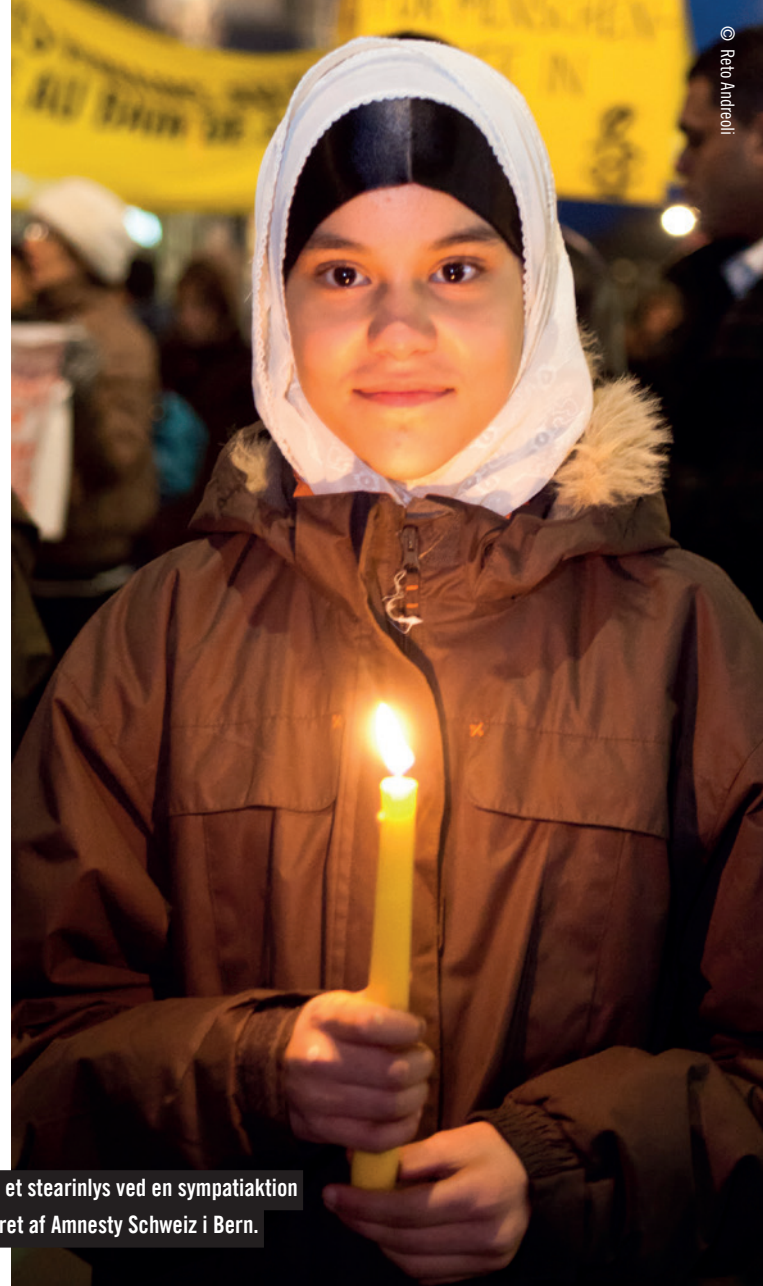
En ung pige holder et stearinlys ved en sympatiaktion for Libyen arrangeret af Amnesty Schweiz i Bern.

Vidste du, at du i nogle tilfælde kan efterlade en gave til Amnesty i dit testamente og samtidig give en større del af arven end ellers til dine efterladte? Det sker ved, at du gør Amnesty til arvemodtager på betingelse af, at vi betaler boafgiften for de andre arvemodtagere. På denne måde kommer donationen både Amnesty og dine øvrige arvinger til gode.