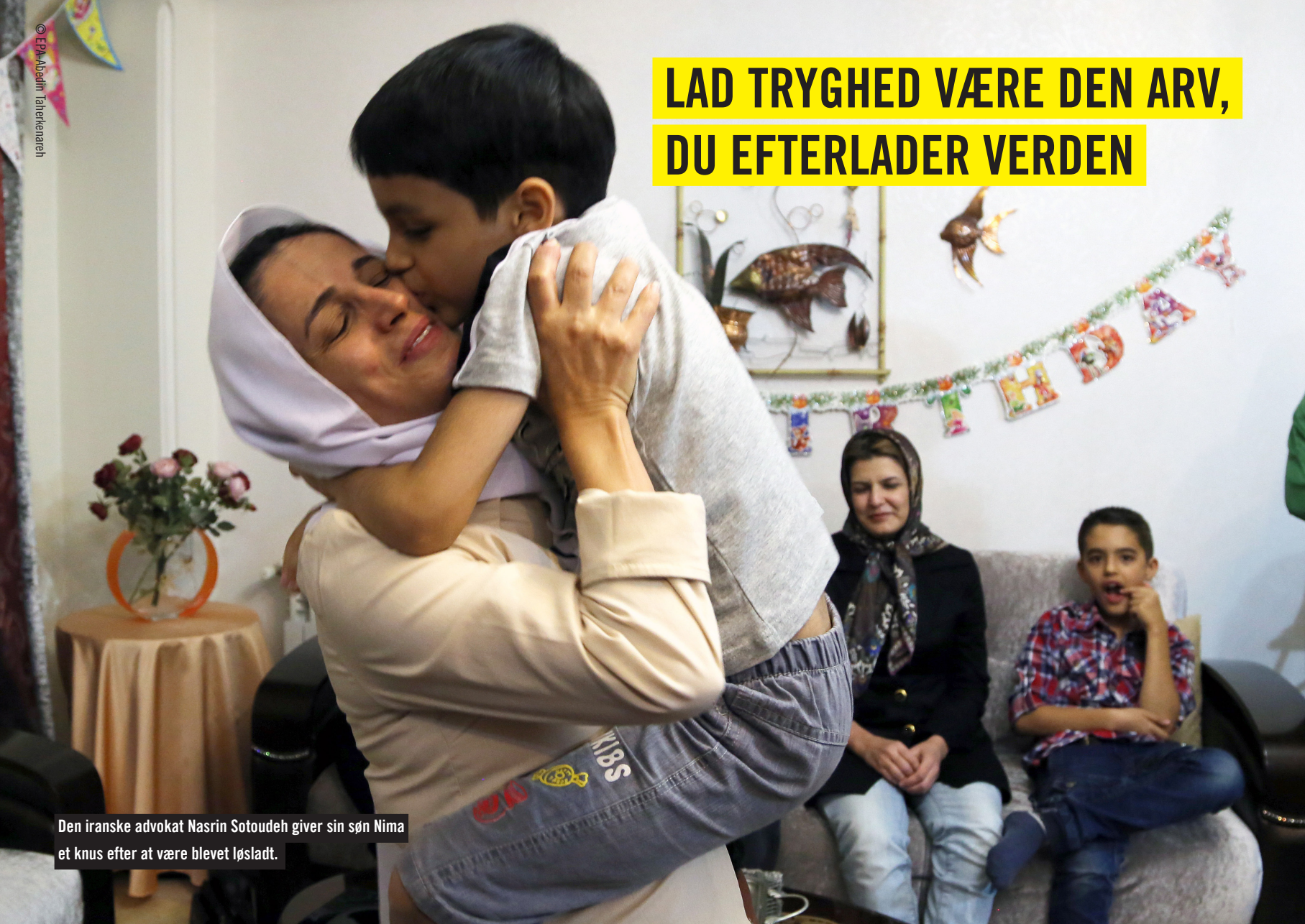
Den iranske advokat Nasrin Sotoudeh giver sin søn Nima et knus efter at være blevet løsladt.