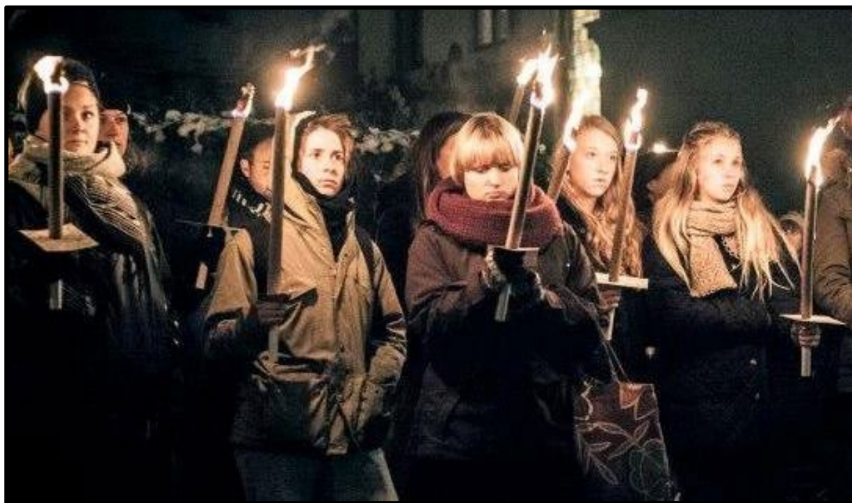
Foto: Deltagerne i et fakkeltog eller en demonstration gør mere end at sende en SMS eller at skrive under på nettet. Men de behøver ikke at have nogen fast tilknytning til Amnesty eller regelmæssigt at være med i vores arbejde. Derfor deltager de i aktivismen på mellemniveau.

Tilbuddene er både være udviklet af sekretariatet, af lokalt aktive, youth-aktive og specialgrupper, og vi har lært at samle deltagertallene sammen fra hele landet og ikke kun det centralt organiserede.