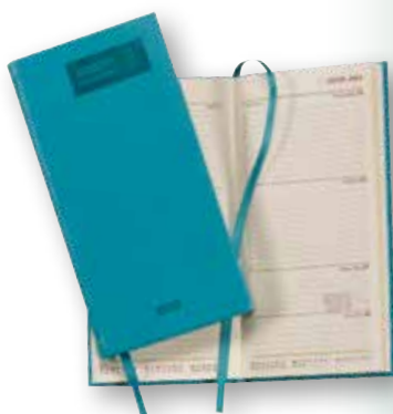
Lommekalender 2019 Med Amnesty logo kr. 120,-