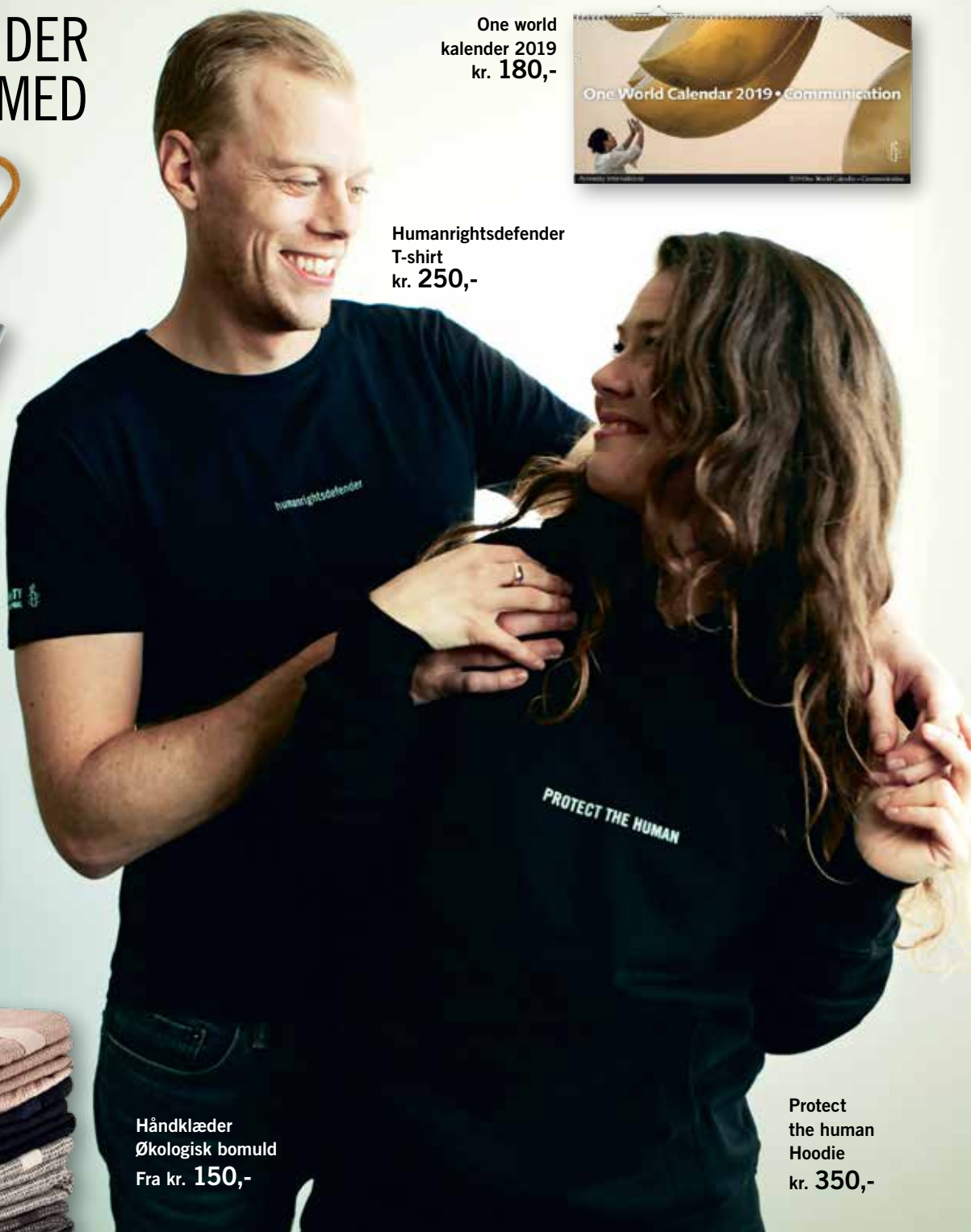
Protect the human Hoodie kr. 350,-