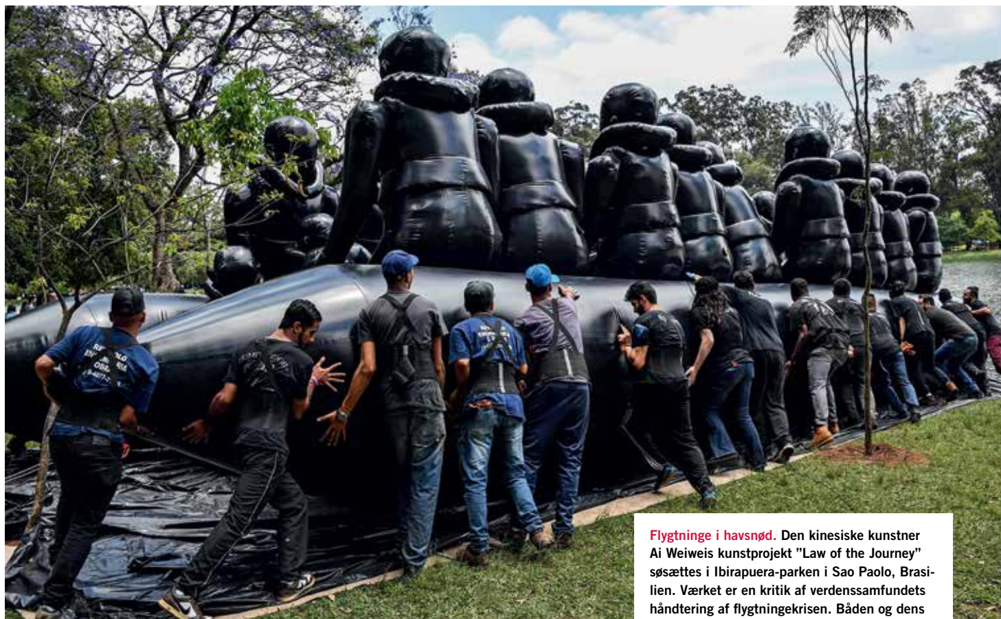
Flygtninge i havsnød. Den kinesiske kunstner Ai Weiweis kunstprojekt "Law of the Journey" søsættes i Ibirapuera-parken i Sao Paolo, Brasilien. Værket er en kritik af verdenssamfundets håndtering af flygtningekrisen. Båden og dens passagerer er lavet af det samme materiale, som de både, der bruges af flygtninge på vej over Middelhavet.