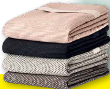
Håndklæder Økologisk bomuld Fra kr. 150,-