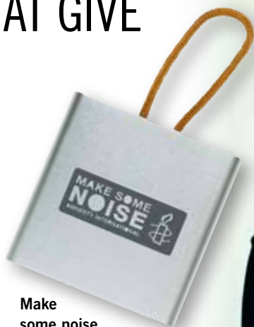
Make some noise Bluetoothhøjttaler kr. 300,-